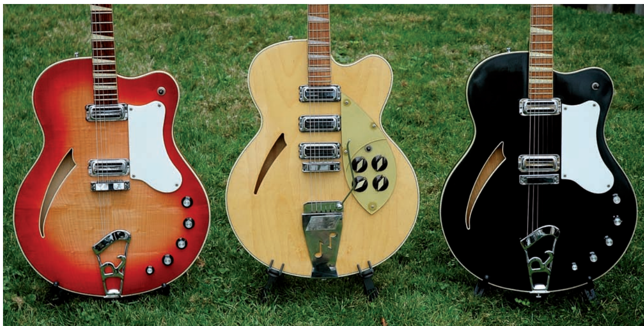
Photo 4-Une 360F Fireglo de 1967 (à gauche) et une 360F Jetglo de 1968 entourent une 375F Mapleglo de 1961

Une autre idée audacieuse a consisté à faire renaître les modèles de la série "F", avec un design osé qui plaçait les boutons de volume et de contrôle sur des bords d'un large corps de 16 pouces, paré d'un double filet, toujours avec le damier en filet interne. Ce corps était plat comme le corps d'une thinline, d'une épaisseur de 4,45 cm, la même épaisseur qu'une 330 ou une 360. Ce modèle, qui était une relecture moderne des modèles en "F" de