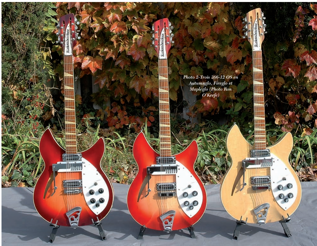
Photo 2-Trois 366-12 OS en Autumnnglo, Fireglo et Mapleglo

Vous avez plusieurs Rickenbacker 12-cordes dans votre collection. Il semble que le son de la 12-cordes était populaire à une certaine époque, au milieu des années 60 mais s'est perdu après. Que s'est-il passé?