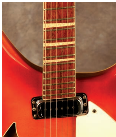
Photo 7B-Vue de la touche de la 360 Fireglo 1971. Notera le micro positionné au même angle que les frettes.

Je ne crois pas qu'une collection serait complète sans quelques basses Rickenbacker. Il y a eu plusieurs phases dans le développement des basses Rickenbacker. Bien que Rickenbacker ait