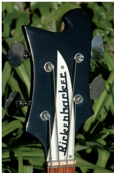
Photo 8B-Gros plan sur la tête et la frette zéro d'une basse 4001C64S

commencé à produire quelques basses en 1958, la basse Rickenbacker n'a pas été utilisée par des musiciens de renom avant le milieu des années 60. Il y eut un arrangement tacite avec les Beatles concernant l'utilisation par Paul McCartney d'une basse Rickenbacker 4001S sur l'album "Magical Mystery Tour". Ceci a grandement contribué à attirer l'attention des bassistes sur la basse Rickenbacker, qui existait soit en ornementation Deluxe ou "S" (Standard). Le modèle "S" correspondait à un style d'ornementation qui était l'équivalent de l'ornementation "non-deluxe" pour les guitares : pas de filet autour du corps ou du manche, et des repères en pastilles au lieu des repères s'étendant sur toute la largeur de la touché. Ces repères étaient réalisés en nacre poudrée. En honneur de la contribution de Paul McCartney à ses basses, Rickenbacker a réédité une version de la basse sous la référence de 4001C64, avec une tête inversée distincte et un cache de barre de réglage courbé en sens inverse, pour signaler le côté gaucher de Paul. Cette réédition existe aussi dans une version alternée avec une finition satinée et une corne passée au papier de verre ou re-profilée, comme celle de Paul, ainsi qu'une frette zéro, un autre clin d'oeil aux modifications que Paul McCartney avait effectuées sur sa basse Höfner. (Photo 8A et 8B). Le son très particulier de la basse Rickenbacker s'est révélé à