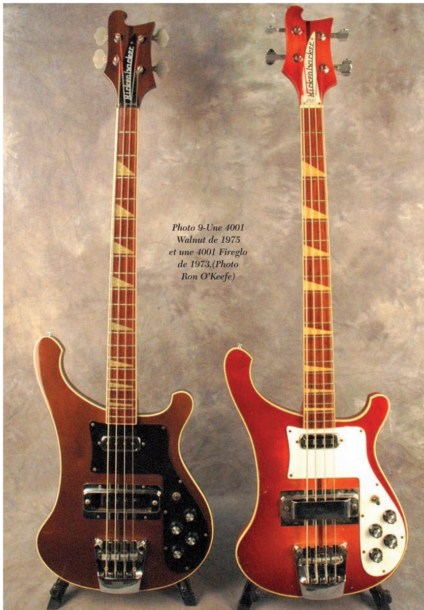
Photo 9- Une 4001 Walnut de 1975 et une 4001 Fireglo de 1973.

manche. Le son Rickenbacker distinctif s'imposa et devint populaire auprès des bassistes de rock progressif comme Chris Squire et Geddy Lee. Ce qui a ensuite accentué la popularité de ce modèle, ce fut le design en "cresting wave", que l'on avait d'abord rencontré sur les solidbodies Combo de la série 400 au début des années 60. Sur la basse Rickenbacker la "cresting wave" fut un élément du design à la fois du côté bas du corps mais également du sommet de la tête. Aujourd'hui le design et le son unique de la basse Rickenbacker l'ont rendue très populaire auprès de bassistes de tous styles de musique. En 1973, Rickenbacker a fait des changements d'ornementation sur le mo-