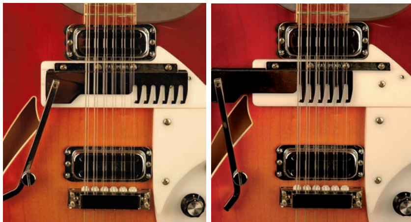
Photos 1-Gros plan sur le mécanisme de conversion de 12 cordes en 6 cordes. Le convertisseur est désengagé (à gauche), ou engagé (à droite)

La 12-cordes convertible devait, en théorie, permettre au musicien, par un simple mouvement du peigne à six dents, de tirer les cordes d'octave vers le bas et de les retenir en dessous de la zone d'at-