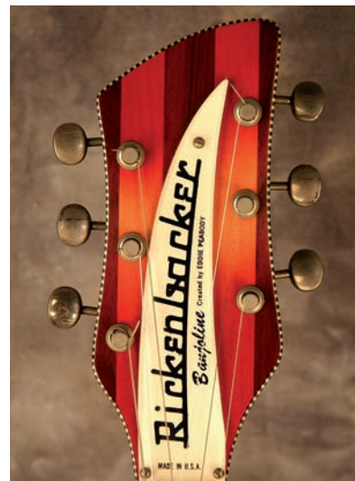
Photo 5-Tête de 6006 Banjoline Fireglo de 1969, créé avec Eddie Peabody

La fin des années 60, début des années 70 a vu des changements drastiques dans la production de Rickenbacker. La guitare 12-cordes avait perdu en popularité et les modèles convertibles 6/12 n'étaient pas non plus très populaires; beaucoup de guitaristes trouvaient le mécanisme de conversion peu pratique et l'enlevaient tout simplement. La guitare convertible fut supprimée du catalogue à la fin de l'année 1968. À cette époque Rickenbacker commença à expérimenter avec des nouveaux modèles de guitares. Le modèle 381 était une guitare pleine caisse avec une découpe allemande ( German carve ) qui ressemblait à un design de archtop, une première pour Rickenbacker. Il y avait une indentation autour de tout le corps, sur la table et le dos, et la guitare était parée d'un double filet, le filet intérieur étant constitué d'une sorte de damier. L'ornementation était dite "Deluxe", et l'on utilisait souvent des érables mouche-